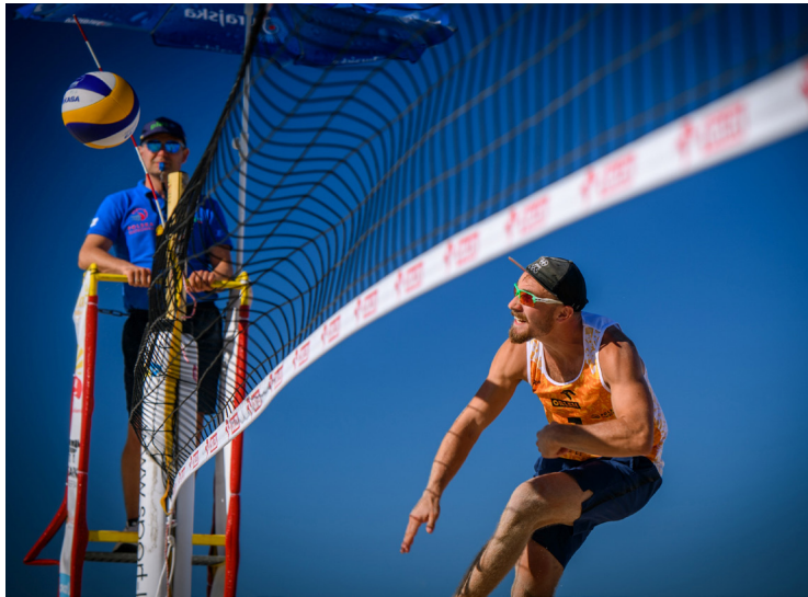
Kołobrzeg 2020

D eklaracja Przewodniczącego Wydziału Siatkówki Plażowej PZPS, sędziego Rafała Pośpiecha złożona w obecności sędziów plażówki i Przewodniczącego Wydziału Sędziowskiego Wojciecha Maroszka, stała się faktem. 5 maja 2021 Zarząd Polskiego Związku Piłki Siatkowej zaakceptował treść w/w dokumentu.