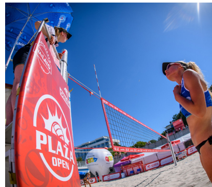
fot. M. Walusza / Kołobrzeg 2020

D obre wieści dla środowiska siatkówki plażowej w Polsce! Swoją premierę ma dokument współtworzony przez całą społeczność siatkówki plażowej w Polsce, również sędziów i komisarzy PZPS - Handbook Siatkówki Plażowej na rok 2021 .