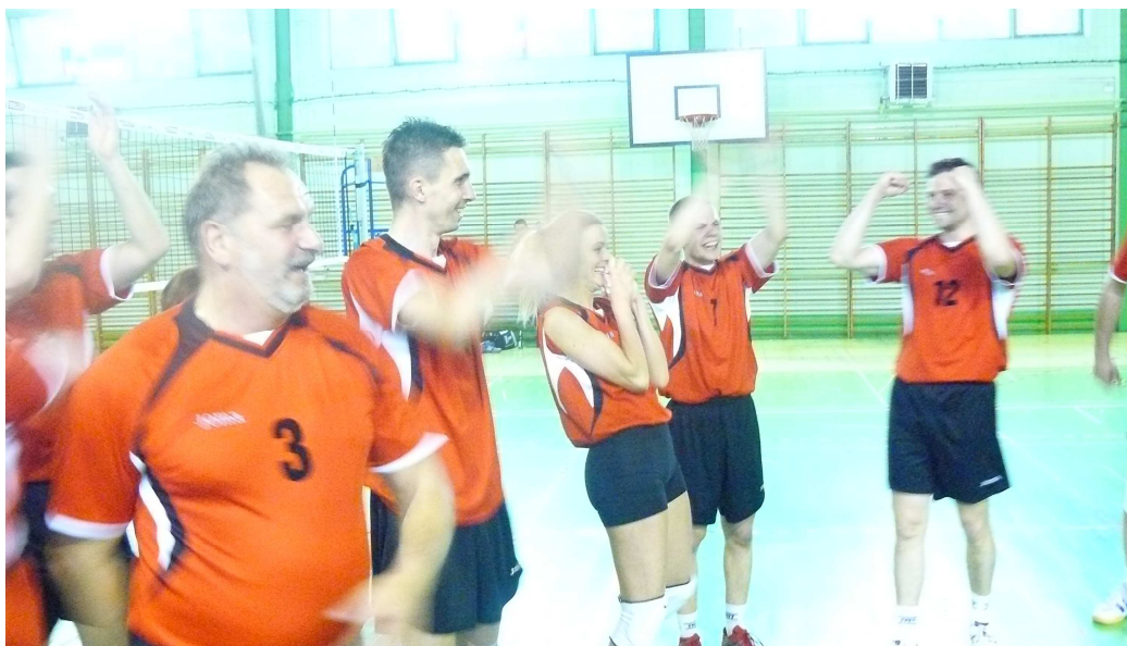
Zwycięstwo w turnieju trafiło w ręce zespołu z Lubuskiego