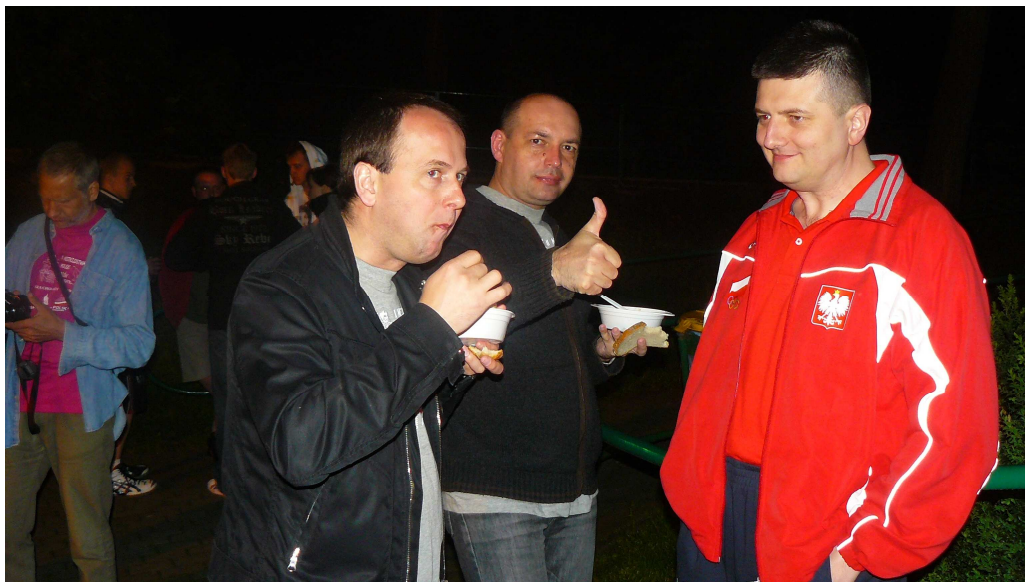
Udane zajęcia integracyjne spowodowały, że także przegrani dobrze się bawili

informacje: Jan Baniak