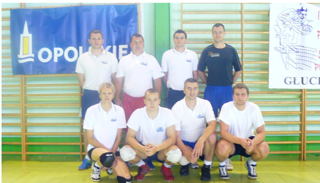
Srebrne medale powędrowałyby do Podkarpackiego (gdybyśmy mieli medale ☺)