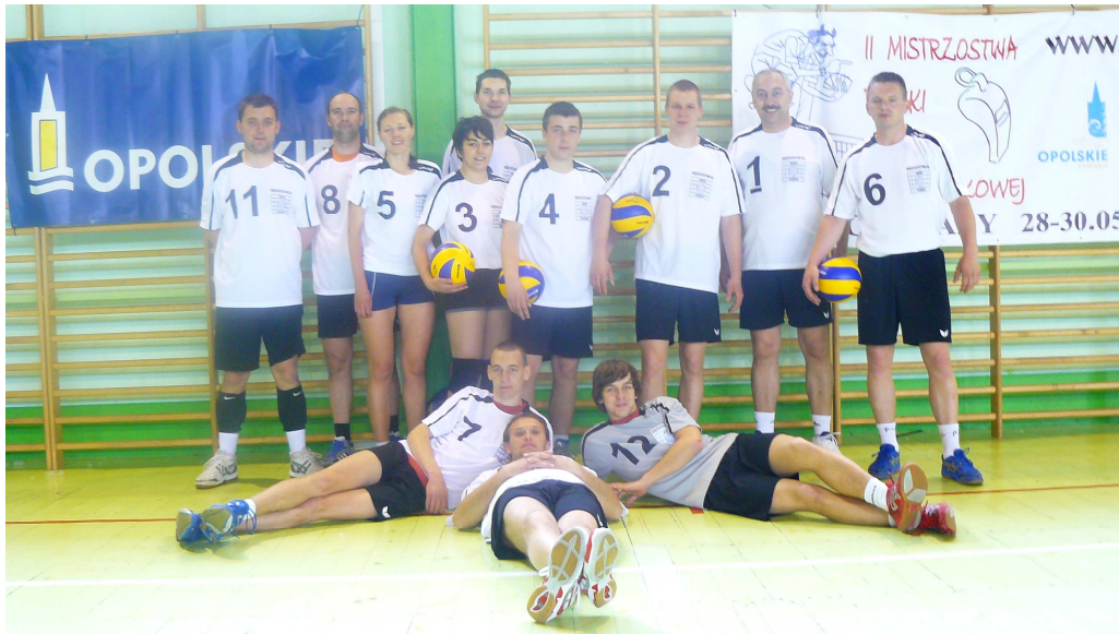
Na trzecim miejscu uplasowała się Wielkopolska