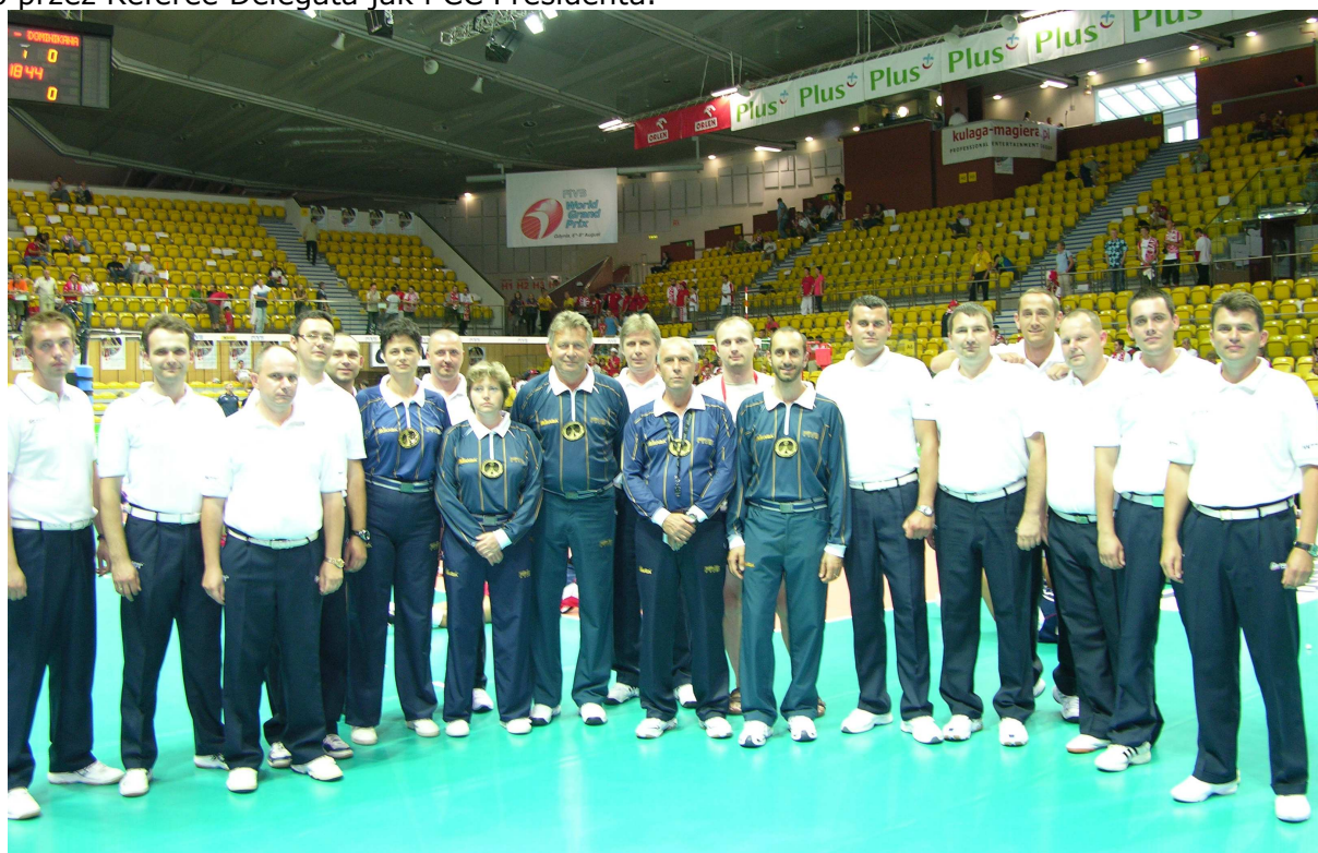
Fot. Sędziowie FIVB World Grand Prix, Gdynia 2010.

Natomiast w trzecim dniu, jak to na zakończenie zawodów, już się coś ciekawego działo. O ile w pierwszym meczu Polki dość szybko pokonały reprezentację USA 3:1 (bo inaczej być nie mogło!), to w meczu kończącym jakże udany turniej, Dominikanki pokonały Niemki 3:2 po bardzo ciekawym i emocjonującym meczu. Długie akcje pobudziły publiczność do żywiołowego dopingowania czy to jednej, czy drugiej reprezentacji. O zaciętości i dramaturgii meczu może świadczyć choćby czas jego trwania: 2 godziny i 39 minut. Dość powiedzieć, że jeden z setów trwał 40 minut, tie-break zakończył się wynikiem 19:17, a w całym meczu Dominikanki zdobyły tylko dwa punkty więcej niż Niemki. Po meczu wszyscy sędziowie z obsady mówili zgodnie, że był to ich jeden z najdłuższych meczów w życiu (mój osobiście najdłuższy). Po całym turnieju, w poczuciu dobrze wykonanej pracy, przyszedł czas na wspólne zdjęcie oraz wręczenie drobnych upominków naszym, zaskoczonym całą sytuacją, gościom zza granicy. Nieskromnie mogę powiedzieć, że wszyscy nasi sędziowie z obsady pomocniczej zostali pochwaleni zarówno przez Referee Delegata jak i CC Presidenta.