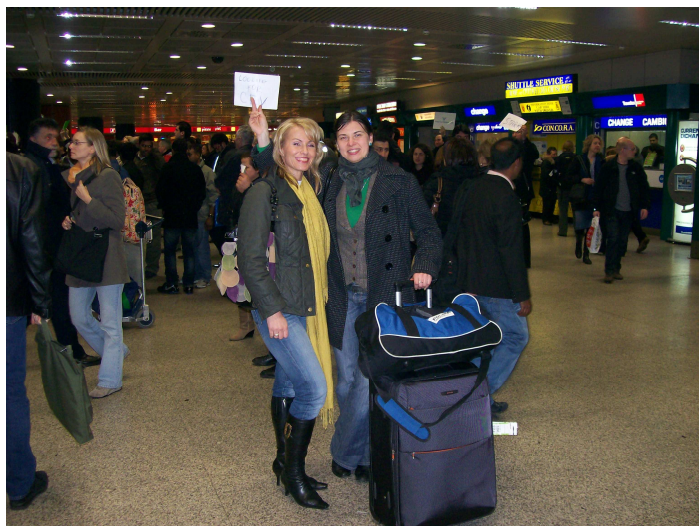
Opóźniony przylot do Rzymu spowodował, że to my szukałyśmy gospodarzy (niestety nieskutecznie)