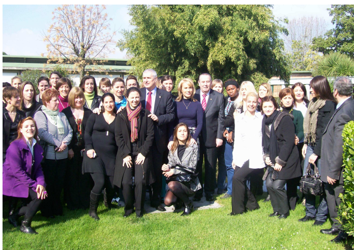
Seminarium towarzyszyła słoneczna pogoda, gdy w Polsce ciągle panowała zima