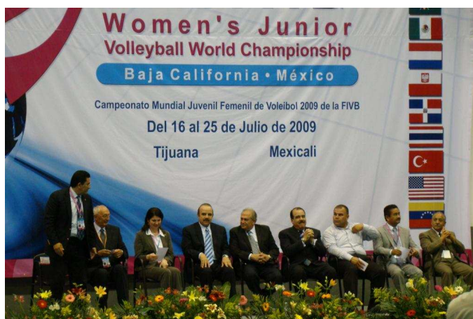
Control Committee – ceremonia otwarcia

Komisji Sędziowskiej i jednocześnie instruktorem kursu dla kandydatów na sędziów międzynarodowych, w którym w ubiegłym roku miałem przyjemność uczestniczyć w Sofii.