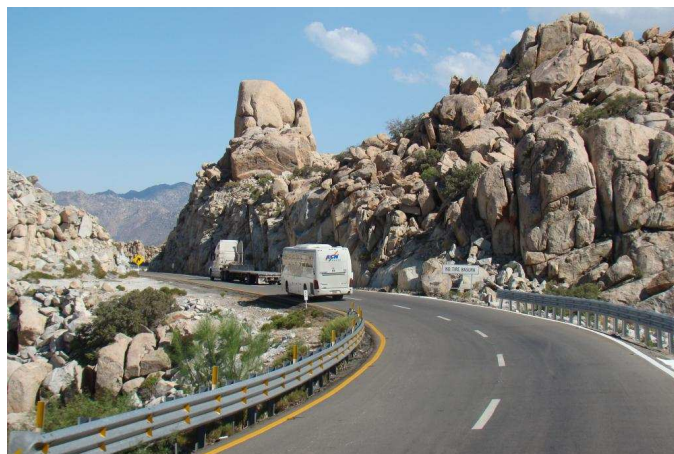
W drodze do Mexicali

Jeszcze tego samego dnia wieczorem odbył się w Mexicali Technical Meeting, na którym obecni byli wszyscy najważniejsi, włączając w to Refereeing Commission i wszystkich sędziów międzynarodowych. Jako Team Manager wraz z trenerem i Panią doktor musiałem tam być obecny i ja.