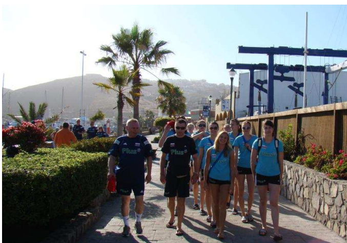
Wycieczka do Ensenady