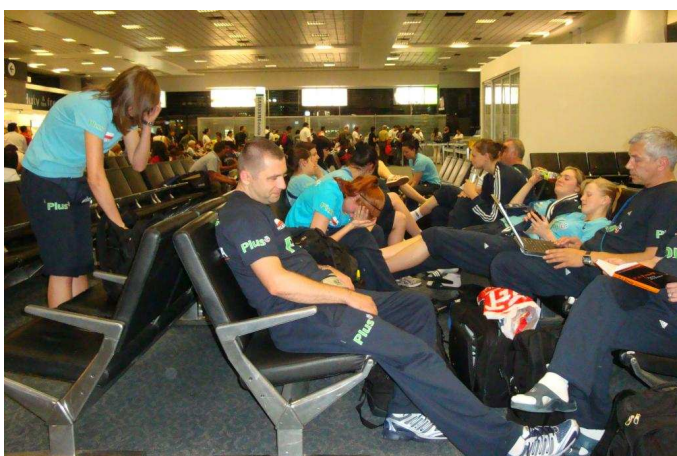
Podróż do Meksyku