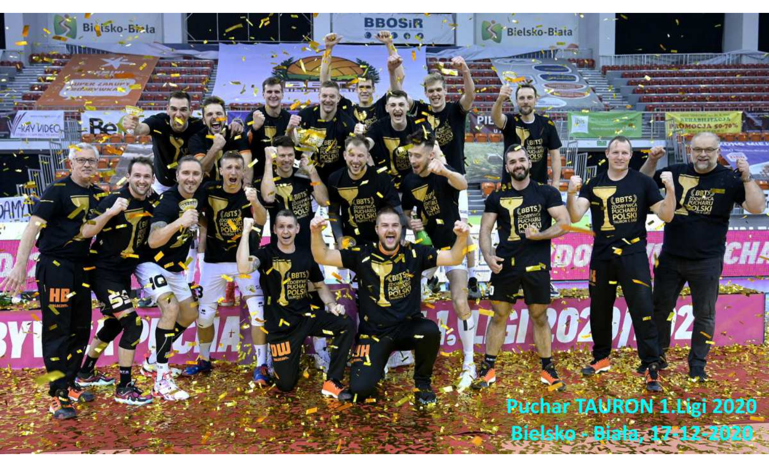
Puchar TAURON 1.Ligi 2020 Bielsko - Biała, 17-12-2020